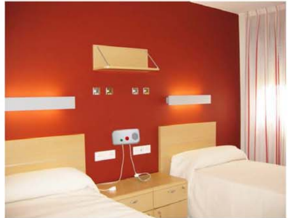
Instalación real habitación doble

Luz indicador alarma para pasillo. Incluye embellecedor adaptación directa. Requiere alimentación. Luz disponible en varios colores y cuatricolor.